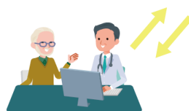
対面診療 / 対面服薬指導