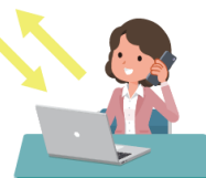
電話診療 / 相談