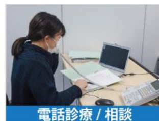
電話診療 / 相談