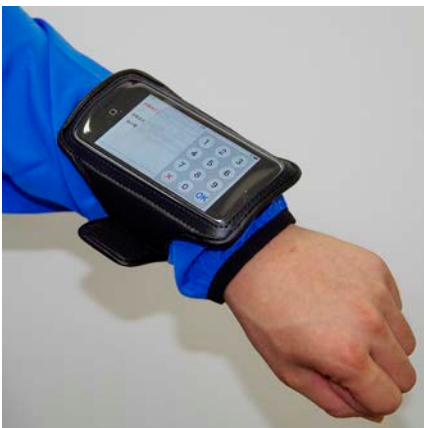
アームバンド装着