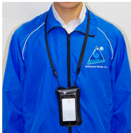
ネックストラップ装着