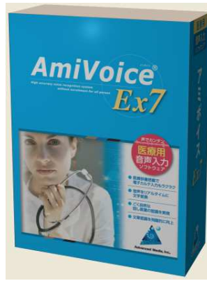
【パッケージイメージ】