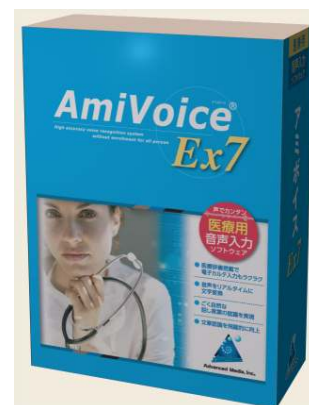
【パッケージイメージ】

製品に含まれるもの：ライセンス数：1ライセンス（1台のパソコンにインストール可能） 同梱物：インストールCD（1枚）・USBハンドマイク（1個）・マニュアル（1冊） 販売方法：代理店販売