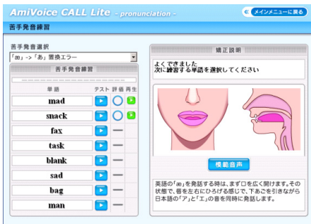
【苦手発音練習画面イメージ】 苦手な発音を集中的に矯正。