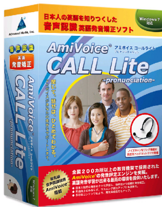
【パッケージイメージ】