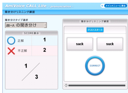
【聞き分けリスニング練習画面イメージ】 日本人が苦手とする発音の聞き分けを練習。