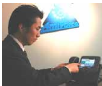
タッチパネル入力