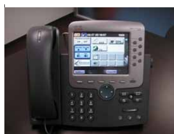
タッチパネル画面例