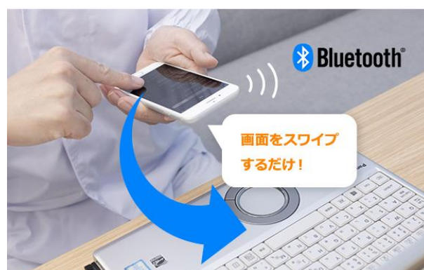
スワイプでデータを PC に転送

専用ハンズフリーマイクデバイス「AmiVoice Front WT01」と AI 音声認識を使い、音声対話で温度記録や消毒記録、味見記録等が行える無料アプリケーションです。音声認識を活用することで、作業中も手を止めず、音声対話によるモニタリング記録の作成が可能です。