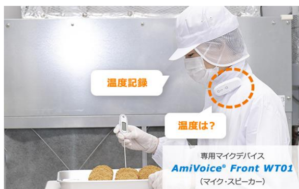
音声対話でモニタリング記録を作成