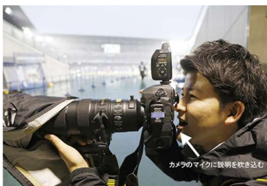
現場のカメラマンが写真を選択、説明を音声で録音

これらの背景をもとに同社のシステム担当者がテキスト変換ツールを精査した結果、音声認識ソフト「AmiVoice Ex7 Business」が導入されました。音声認識技術によってカメラマンの声を自動で文字化し、その変換結果を元に写真内容の確認、選別、選手の特典、説明文の編集といった作業を効率的、かつスピーディに行うことができるようになりました。運用は2019年ラグビーW杯日本大会からスタートしました。